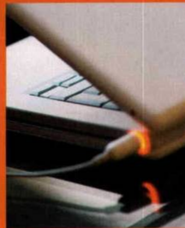
4 h du matin: mon ordinateur est toujours allumé.