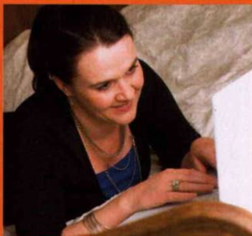
2 Un match de catch? Ce sera sans moi...