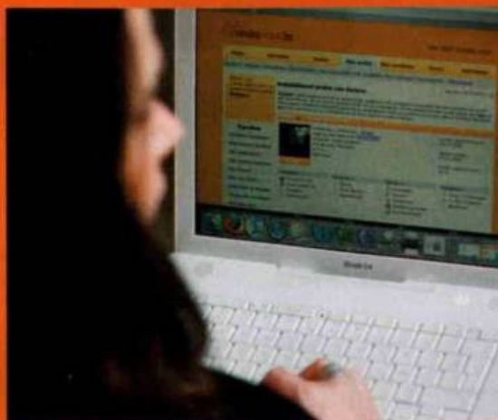
Boîte de réception: 259 messages reçus.